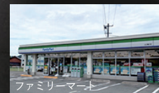
ファミリーマート